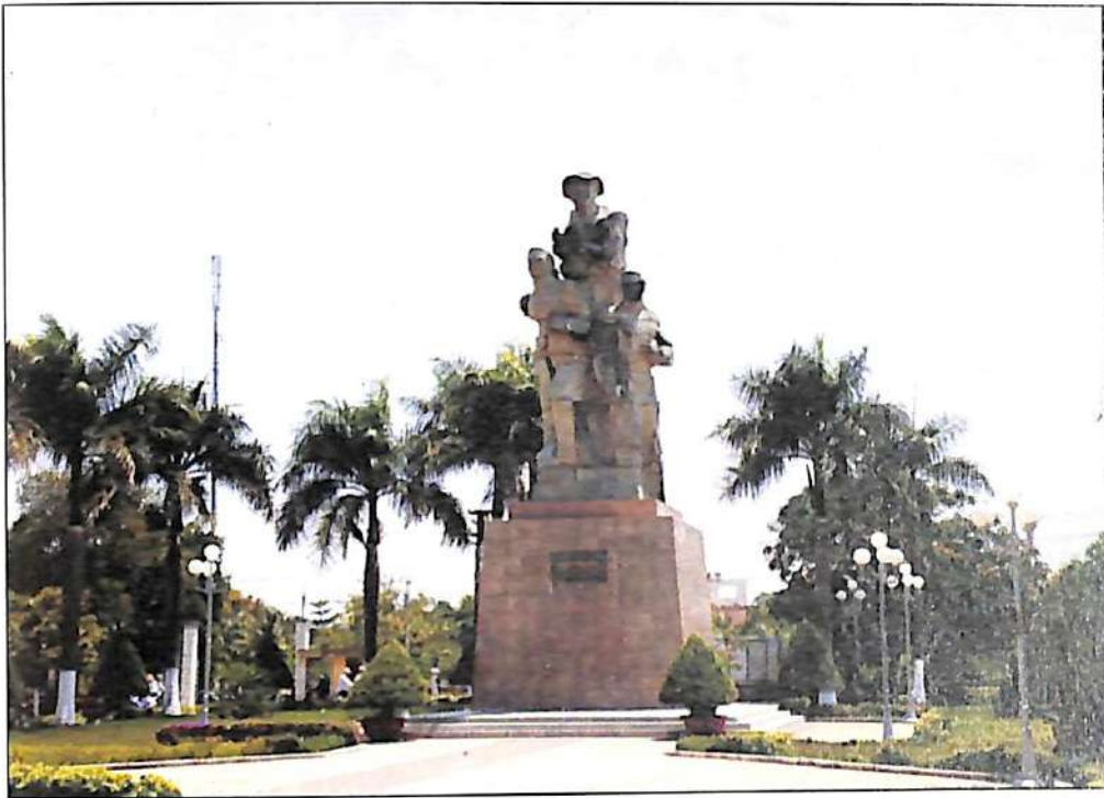
Đài Chiến thắng Thị xã Gò Công