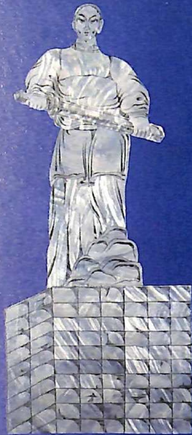
ANH HÙNG DÂN TỘC BÌNH TÂY ĐẠI NGUYÊN SOÀI TRƯƠNG ĐỊNH 1820 - 1864