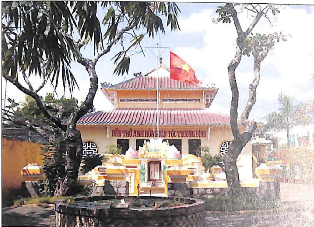
Đền thờ Anh hùng dân tộc Trương Định