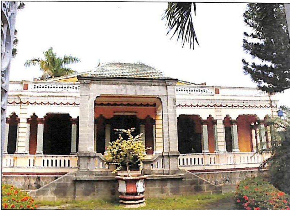
Nhà cổ Đốc Phú Hải (nay là Bảo tàng thị xã Gò Công)