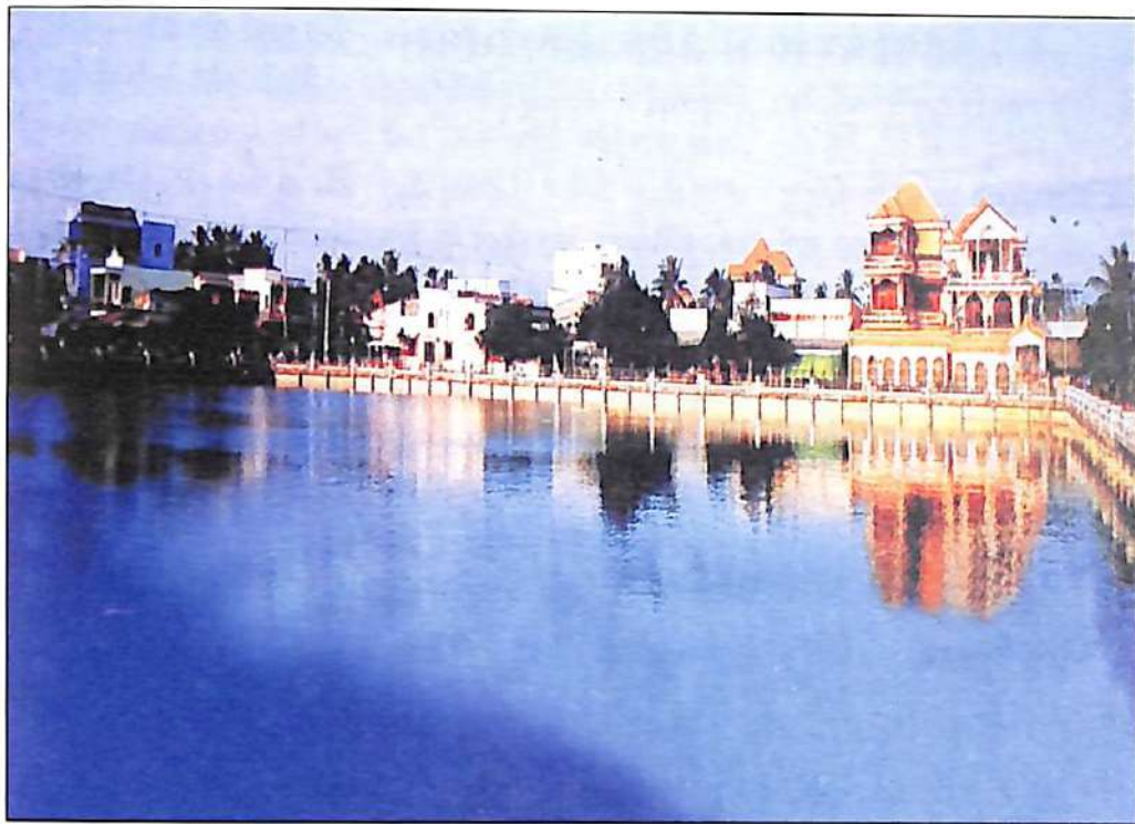
Ao Trường Đua - Ảnh: Long Vân