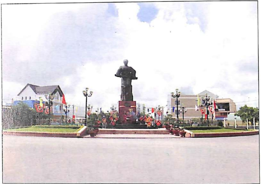
Tượng đài Anh hùng dân tộc Trương Định tại Thị xã Gò Công