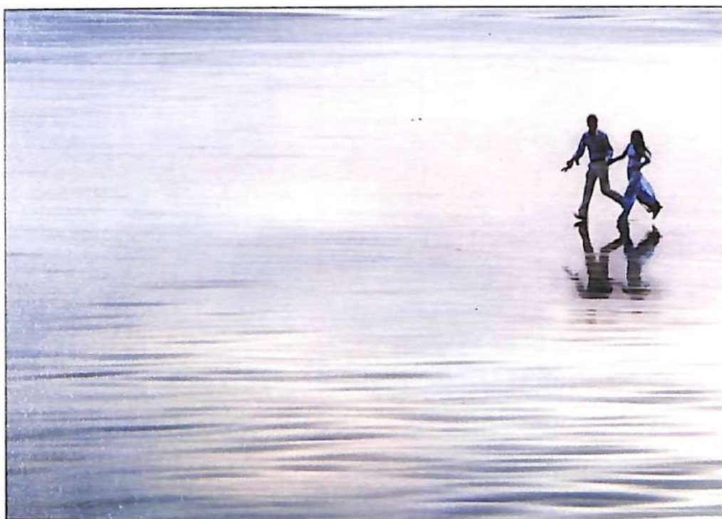
Chỉ có đôi mình