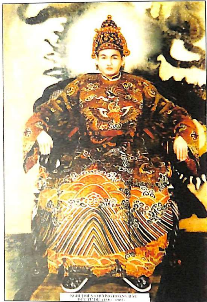
Nghi Thiên Chương Hoàng Hậu Đức Từ Dự (1810-1901)