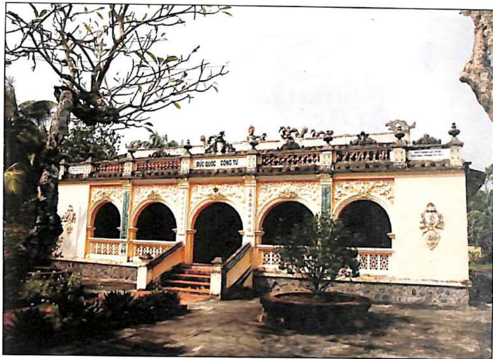
Lăng Hoàng Gia