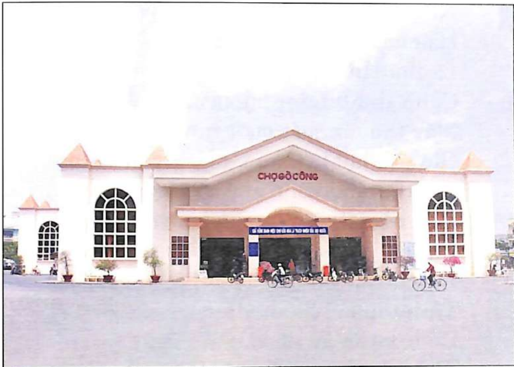
Chợ Gò Công